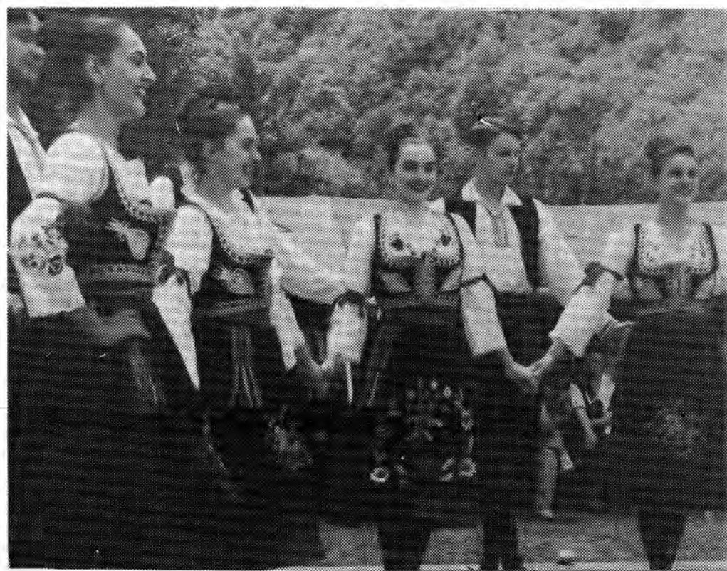
"Игра коло ђевојака" (послије откривања споменика вожду Караћорђу)