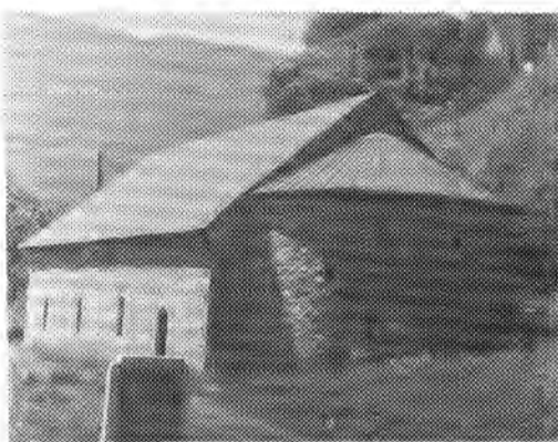
Брезојевићка црква

Једнога дана снаха повјери све крви да је у другом стању, чему се ова јако обрадова. Цијело је село одлијегало од пушњава кад се Зеку роди син. На крштењу му дадоше име Никола, и поп га уведе у књиге као ванбрачно дијете. Зеко и његова мајка препирали су се с попом, но друге није било.