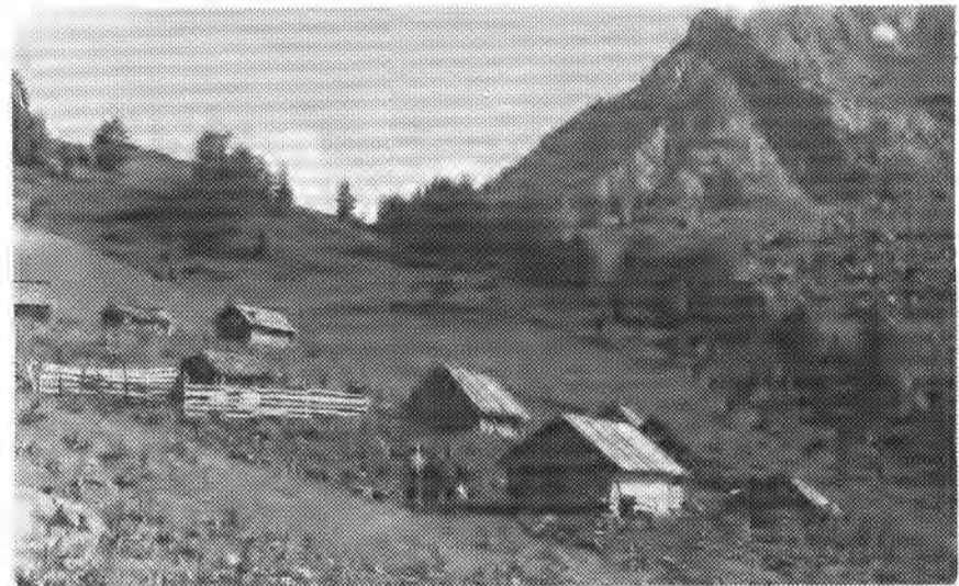
Катун Ваљевски лаз испод Комова

Заноћио свијету у заладу, зимоваћу све будуће зиме. А кад прољећна вода крене, кад се с потоцима улијем у риме, обале ће шаптати и мене.